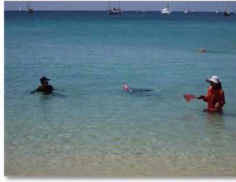
พบตัวอย่างแมงกะพรุน