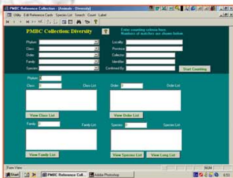
การสืบค้นข้อมูลความหลากหลาย ตัวอย่างในพิพิธภัณฑ์สัตว์และพืชทะเล